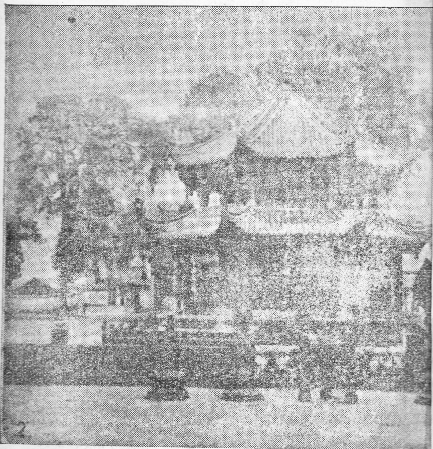
Pasebau segi delapan jang amat indah di Klenteng Kambang Item di Chengtu, Szechuan.

Itoe koeboeran besar, jang masih ada sampe sekarang, terkenai sabagi Sui Tsai Fen, dan dipandang sabagi tempat soetji.