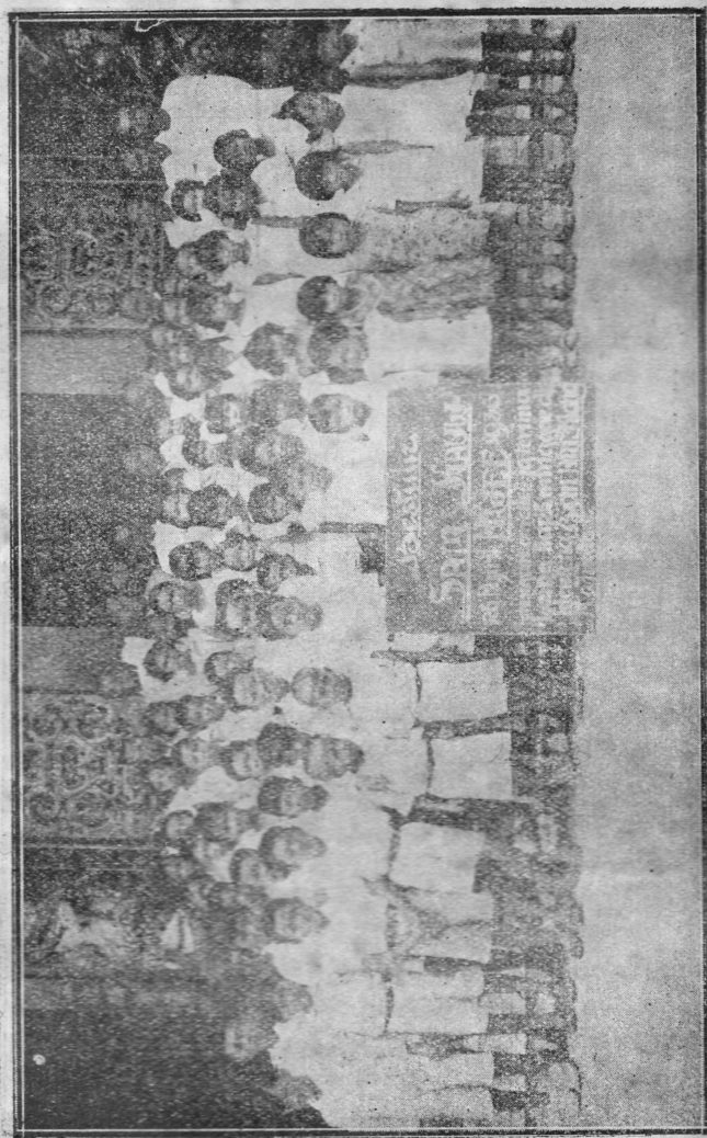
•Bagian moeka dari kluenteng Ban Hin Kiong sabelonnja itoe lezing dibikin.