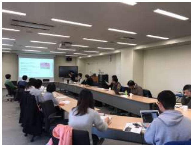
当日の様子（撮影者：新保奈穂美）

引用文献：浅野悟史（2017）、「農村計画学のフロンティア」シリーズを語る—『ラオスの森はなぜ豊かにならないのか—地域情報の抽出と分析』。農村計画学会誌 36(2), 205-206