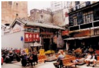
マカオのたたずまい 植民地マカオの市政庁の建物、またその前の広場附近は、確かにポルトガル風に見える。しかし、そこからちょっと小路に入ると、もう庶民の生活空間になる。華南でよく目にする風景と、ほとんど変わらない。 (ポルトガル領澳門。1998年11月3日。)