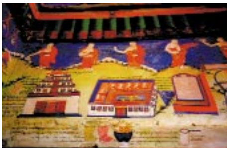
リキール寺の壁画

研究者の主体的発想による技術仕様の策定は、本センターのように、言語・歴史・民族・情報の各分野の専門研究者を擁し、技術と研究の相互刺激を主眼として研究を進める専門機関によって、はじめて生れ得る成果と言えましょう。