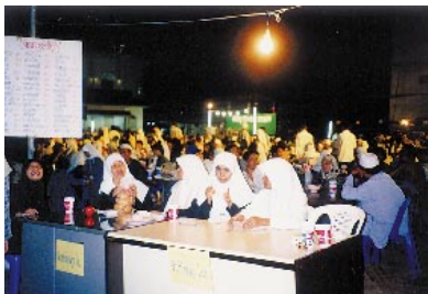
タイのラマダーン バンコク郊外、ラマダーン（断食）期間中は夜様々な催しが行われる。こんなにムスリムがいたのかと驚くほど何千人もの人出でにぎわう。食べ物や衣類の出店が立ち並ぶ様子は、タイ仏教徒の祭りとは何ら変わらないかのようなのである。ただ、女性がベールを、男性が帽子をかぶっていること、催しがタイボクシングや映画ではなく、金融についての討論会であったところが異なる。（1998年1月。西井涼子）