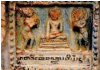
ジャータカのレリーフ

ミンガラーゼーディーは13世紀後半に建立されたバゴダで、外壁にジャータカ (釈迦本生譚) 各譚の場面が彫られている。表面が削られているのは、モンゴル軍によるバガン朝滅亡の際の損壊であろうか。加えて、今世紀になって少なからぬ数のレリーフが持ち去られたという。下に書かれた文字は、現在のビルマ文字と異なる形式である。 (上ビルマ, 旧バガン郊外。1991年4月撮影。澤田英夫)