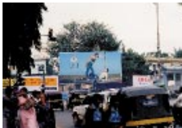
バンガロール市内の1コマ (1998年夏撮影。町田和彦)

粟屋利江 井坂理穂 井上恭子 押川文字子 近藤則夫 佐藤宏 篠田隆 杉山圭子 関根康正 田辺明生 長谷安朗 山田桂子 脇村孝平