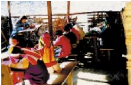
バダウン族観光村の学校

メーホーンソーンの町から車で約40分、ビルマ国境からそれほど遠くないところにその「村」はある。「入場料」を払い、土産物売家々の横を通っていくと、吹き抜けの教室で読本の授業をやっていた。生徒の中には、この民族の象徴である金の首輪をつけた子もいる。読本はビルマの(小学校)第1学年のもの。おそらくはこのクラス、いや村人全体がビルマからの越境出稼ぎなのだろう。