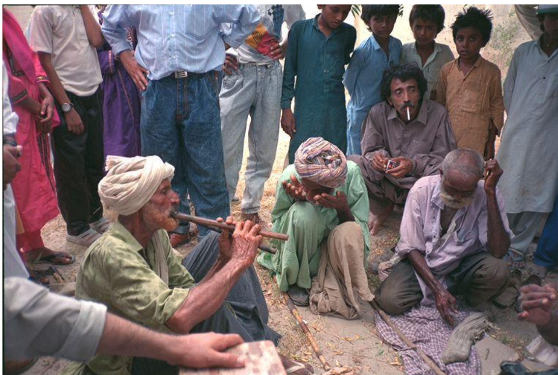
演奏に耳を傾ける村の人々